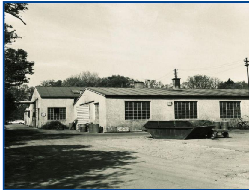
Lo primo stabilimento di lavaggi Christ