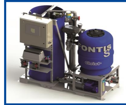
Trattamento delle acque