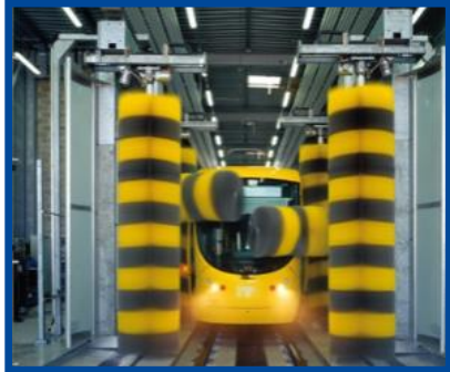
Lavaggio tram i treno