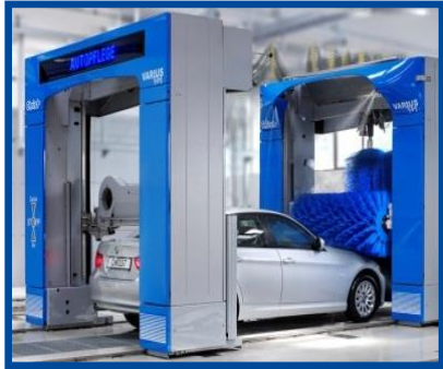
Portali di lavaggio